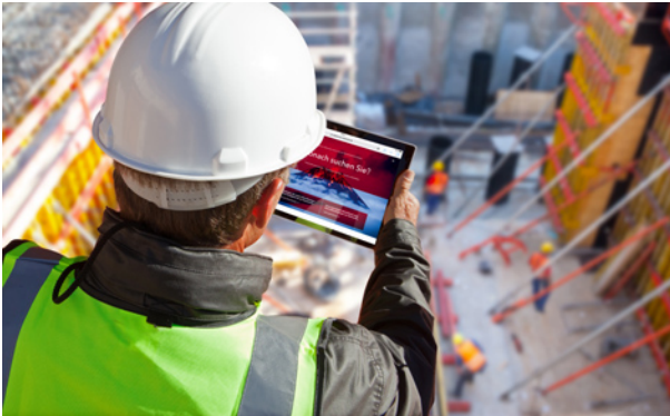
PI Website Relaunch Bild 1.jpg